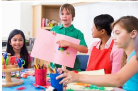
Billedeksempler anvendt i elevinterviews.